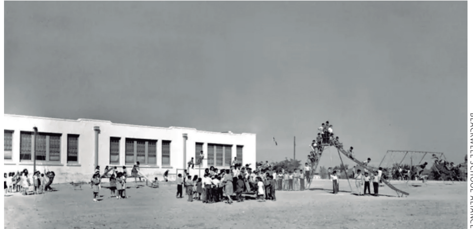
BLACKWELL SCHOOL ALLIANCE

Eskolan afroamerikarrek jasaten zuten diskriminazioa legez aginduta zegoen arren, mexikar jatorriko ikasleekin ez zen gauza bera gertatzen; eskola barrutiek erabakitzen zuten haur latinoekin zer egin. Eta mugaz gertuko estatuetan, Kalifornian, Arizonan, New Mexikon edo Texasen, gehienek segregazioaren aldeko hautua egin zuten. "Mexikarren eskolak" zabaldu zituzten 1940ko hamarkadan; Texas estatuan soilik 120 herri eta hiritan ireki zituzten horrelakoak.